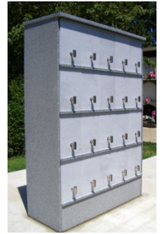
kolunbario erduetako bat