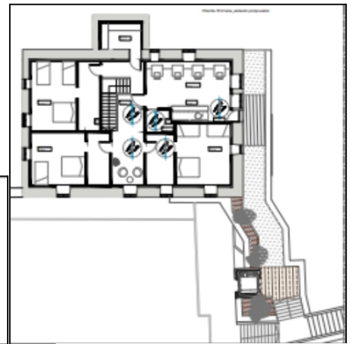
Lehen solairuko planoa eta igogailuaren kokapena