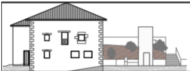
Goiko ostatua eta igogailuaren kokapena alboan